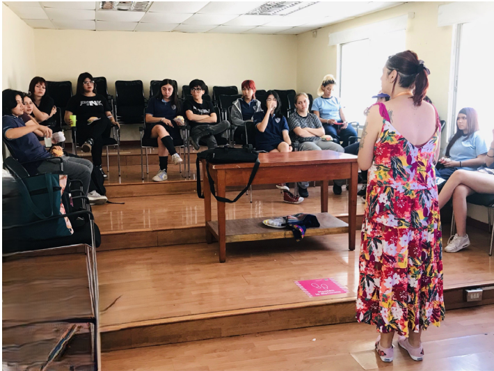
Jornada Liceo Técnico San Miguel, 8 de marzo 2024