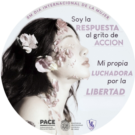
Chapita diseñada por las estudiantes 8 de marzo 2024