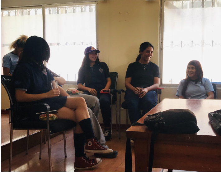
Jornada Liceo Técnico San Miguel, 8 de marzo 2024