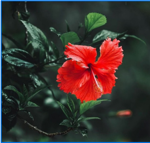
Flor Nacional de Haití