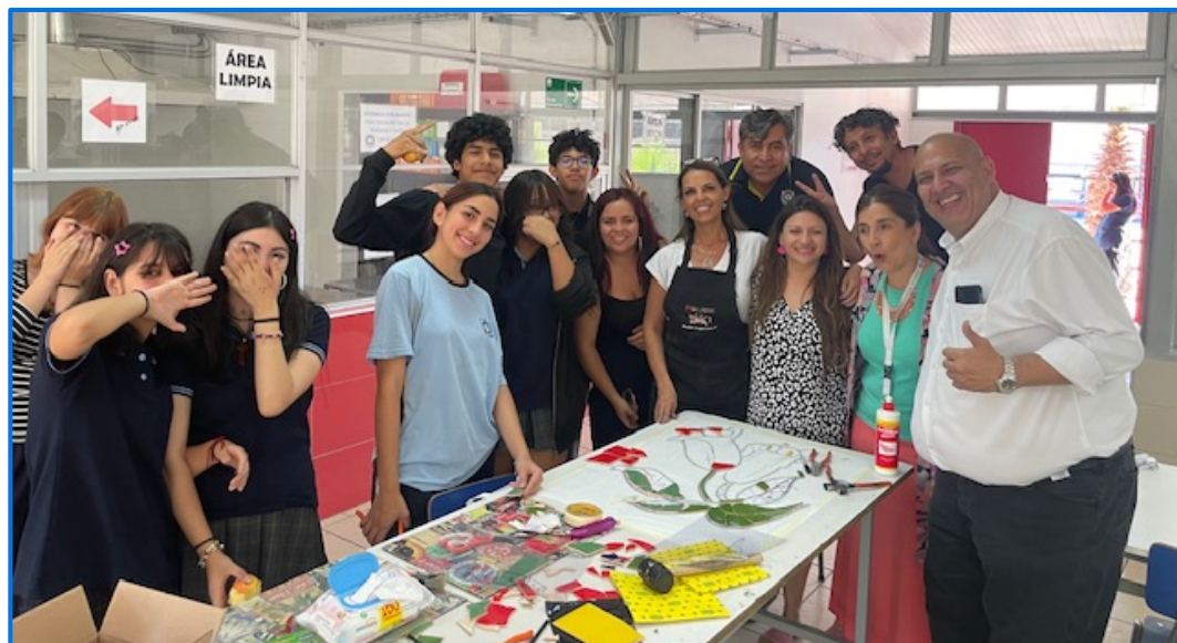
Comunidad educativa participando junto a la experta del segundo taller