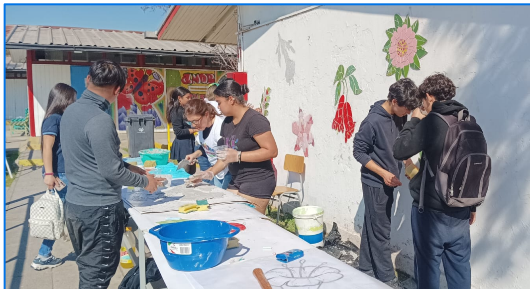
Estudiantes realizando montaje de las flores diseñadas en mosaico en el mural ubicado en el patio central del liceo