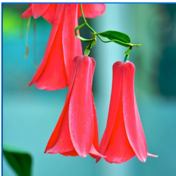
Flor Nacional de Chile