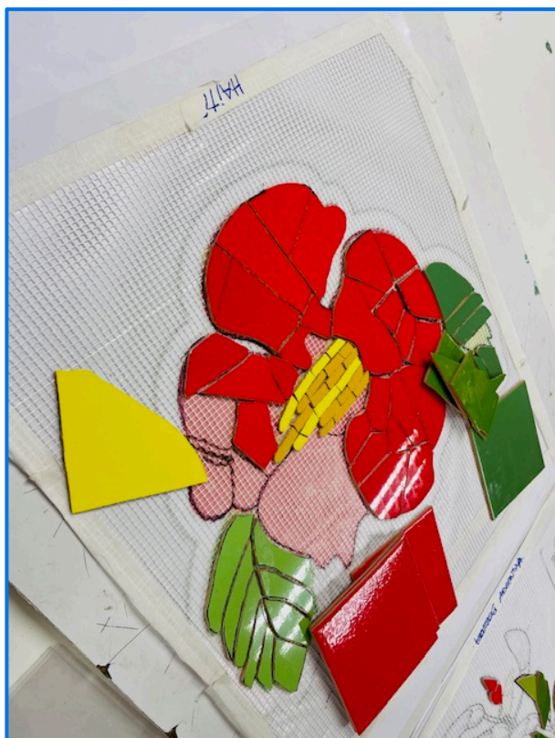
Diseño en mosaico de la flor nacional de Haití