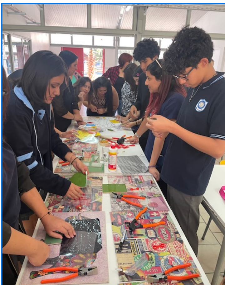
Estudiantes desarrollando la técnica del mosaico