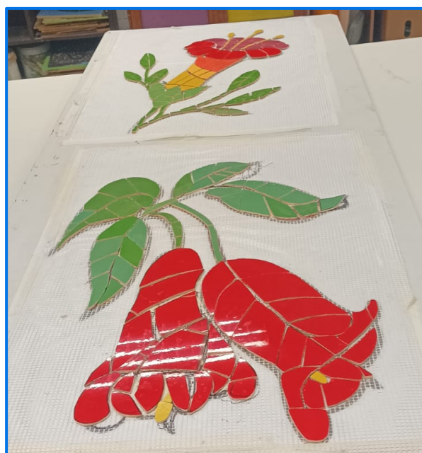
Primeras flores diseñadas en mosaico, trabajadas por la comunidad escolar