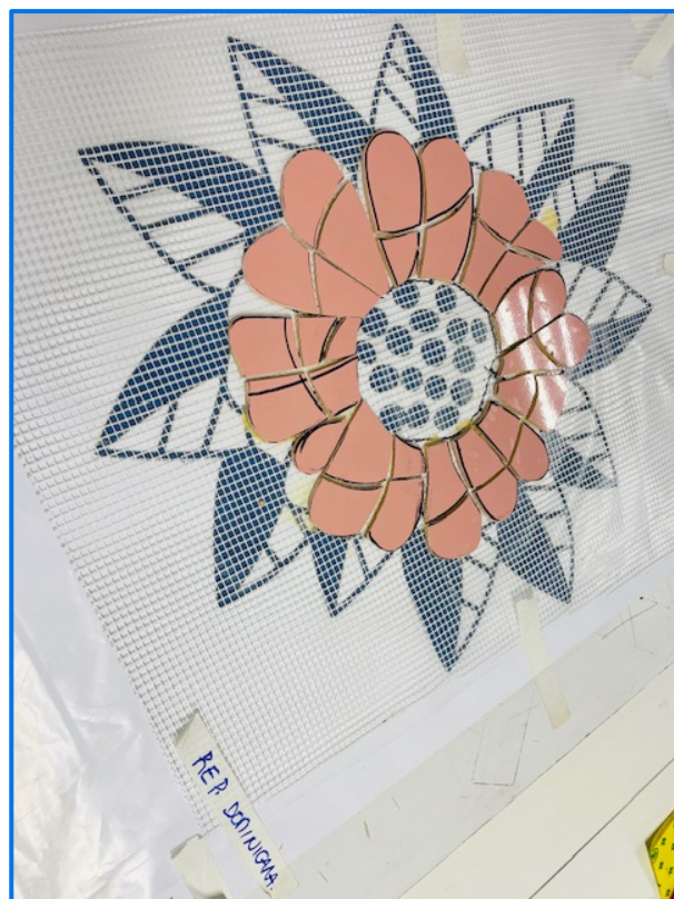
Diseño en Mosaico de la flor nacional de República Dominicana