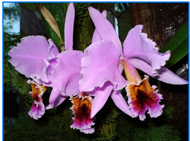
Flor Nacional de Venezuela