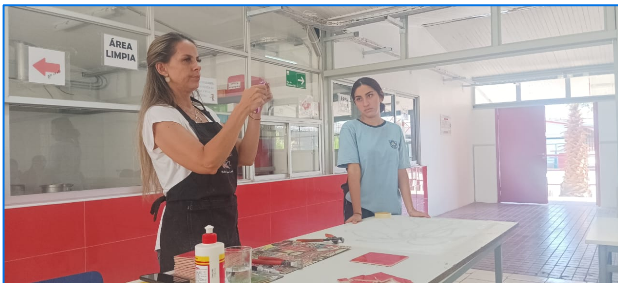
Primer taller realizado por la experta, marzo 2024