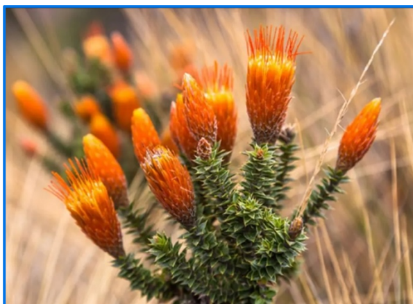
Flor Nacional de Ecuador