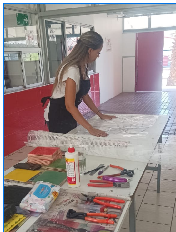
Primer taller: conociendo la técnica del mosaico