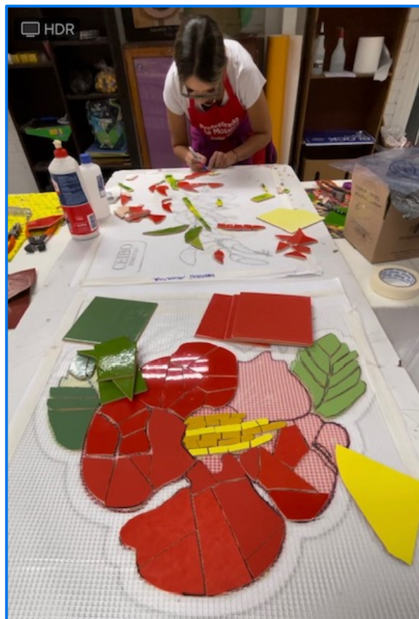
Jornada de trabajo junto al equipo encargado del desarrollo del proyecto