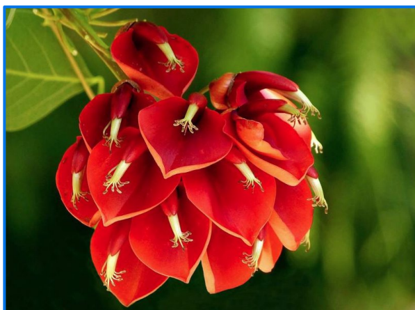
Flor Nacional de Argentina