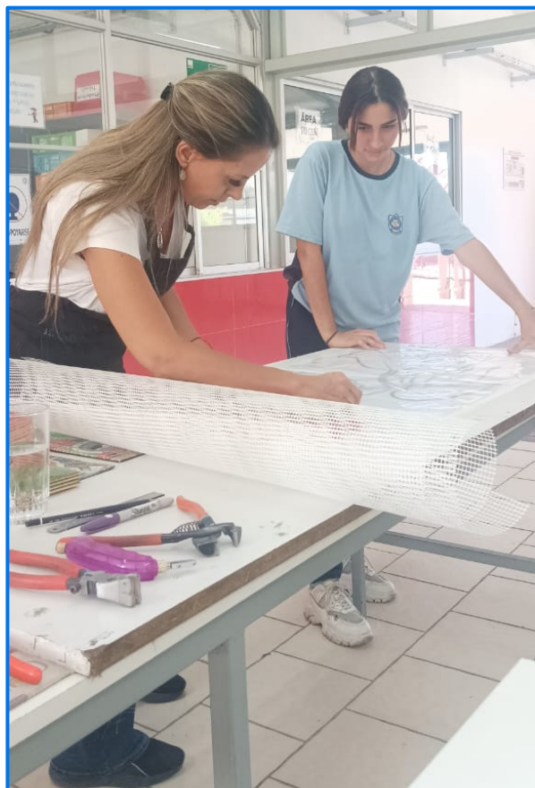
Presentando la técnica del mosaico al estudiantado del liceo