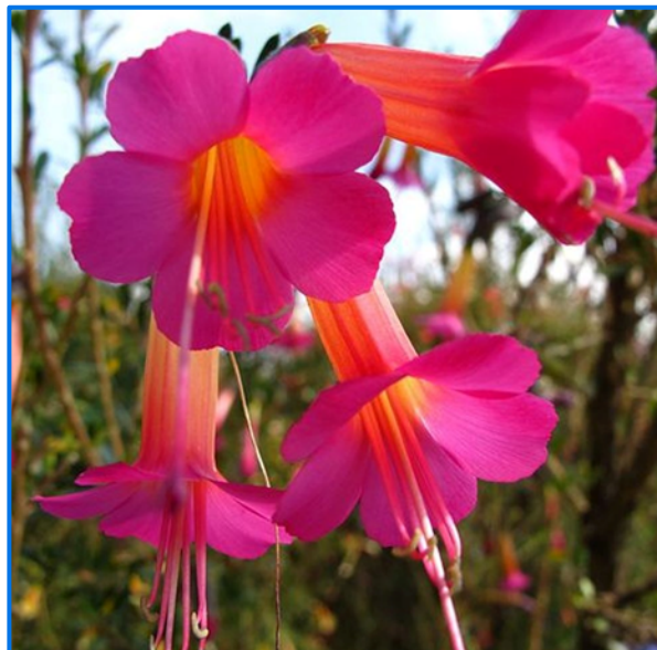
Flor Nacional de Perú