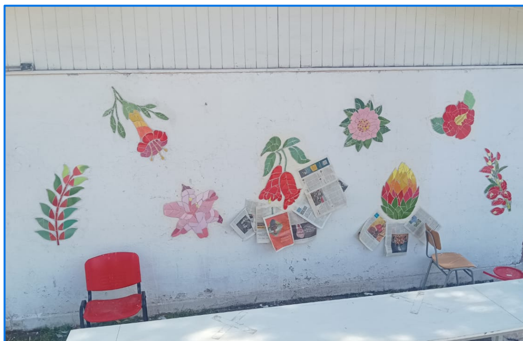
Mural de mosaico multicultural