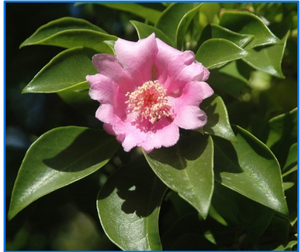
Flor Nacional de República Dominicana